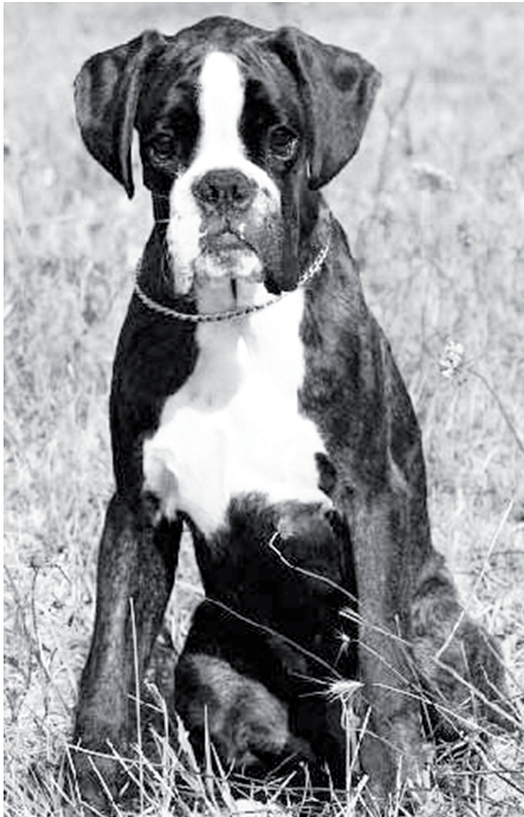
cucciolo tigrato di tre mesi