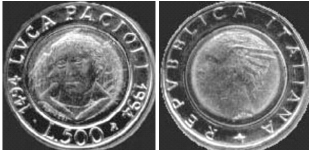
Moneta da 500 lire italiane per il 500° anniversario della pubblicazione della 'Summa' di Luca Pacioli