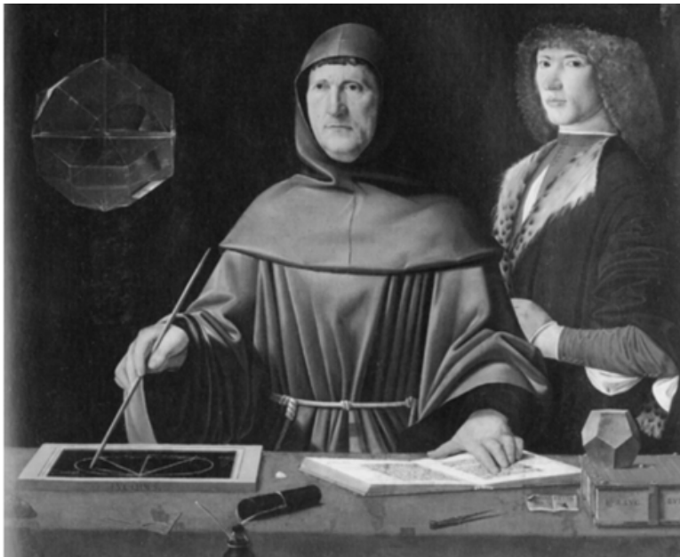
Jacopo de' Barbari (1440-1515) Ritratto di Luca Pacioli Napoli, Museo di Capodimonte