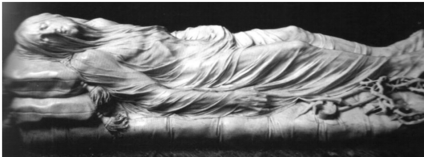
Il Cristo Velato – Giuseppe Sanmartino, 1753 Museo Cappella Sansevero, Napoli

Lapide in basso: Testimonianza dell'avvenuto spostamento dei resti di Corradino di Svevia