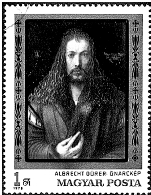
Francobollo Ungherese del 1978