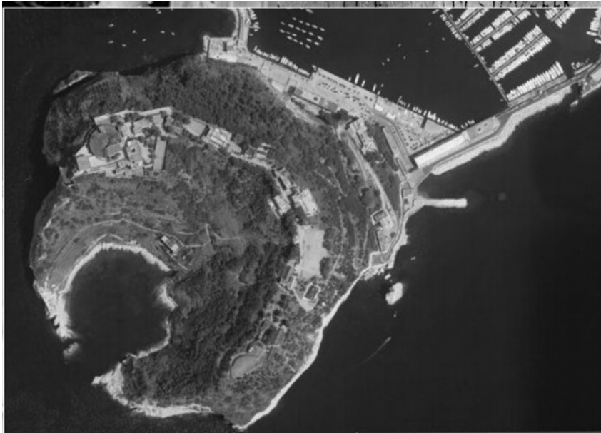
Isola di Nisida, Napoli

Percorso della Sindone seguendo i luoghi in cui è stata documentata la sua presenza