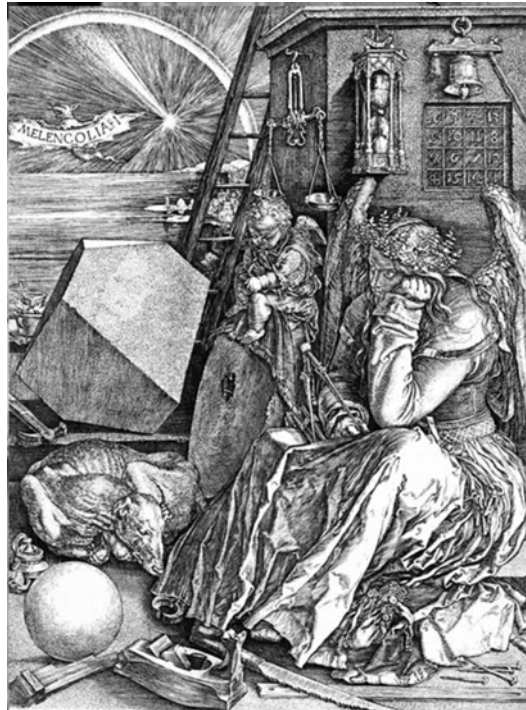
Melancholia 1 - Albrecht Dürer, 1514 Guildhall Library, Corporation of London